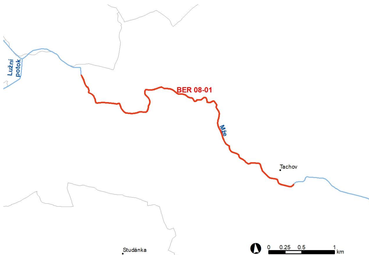
Obr. 1 – Vymezení řešené oblasti s významným povodňovým rizikem