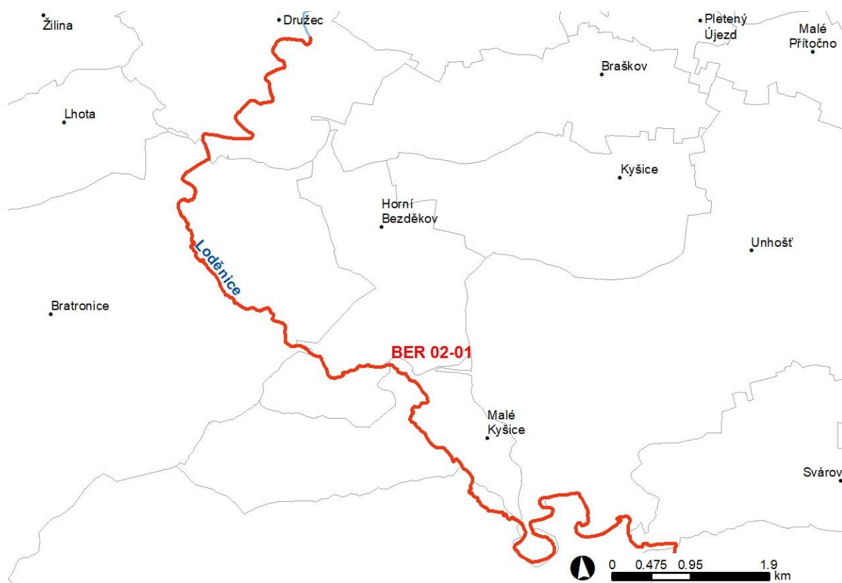
Obr. 1 – Vymezení řešené oblasti s významným povodňovým rizikem