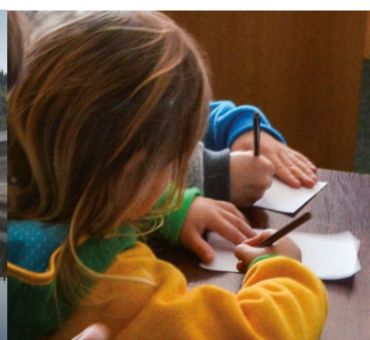
Dětský koutek, soutěže