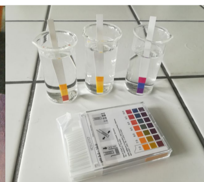
Orientační rozborů pitné vody – ZDARMA