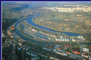
► Ústřední čistírna odpadních vod v Praze ► Zentrale Kläranlage in Prag