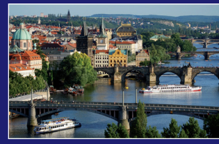
► Protipovodňová opatření v Praze na Vltavě ► Hochwasserschutzmaßnahmen in Prag an der Moldau